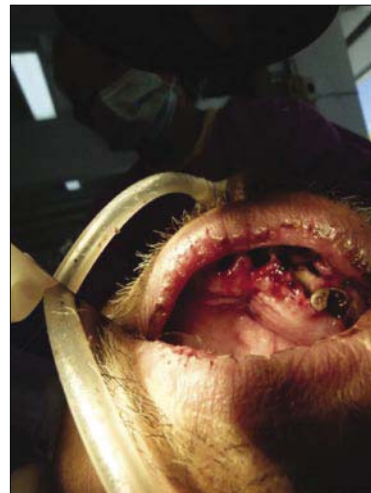
ภาพที่ 2 ลักษณะภายในช่องปากของผู้ป่วย เมื่อแรกรับ Figure 2 Initial intraoral appearance of the patient