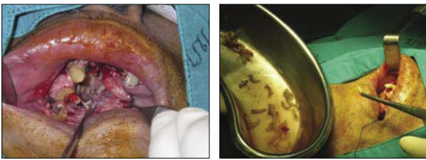
ภาพที่ 4 ภาพขณะผ่าตัด และตัวหนอนแมลงวันที่กำลังตัดออกมา